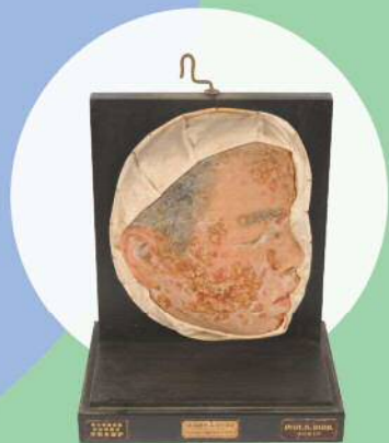
ムラージュ(連鎖球菌性膿疱疹) / 金沢大学医学部記念館蔵

後援: 福井新聞社、NHK 福井放送局、FBC、福井テレビ、FM 福井、丹南ケーブルテレビ、 たんなん FM79.1MHz、性の健康医学財団、福井県医師会、武生医師会、武生郷友会