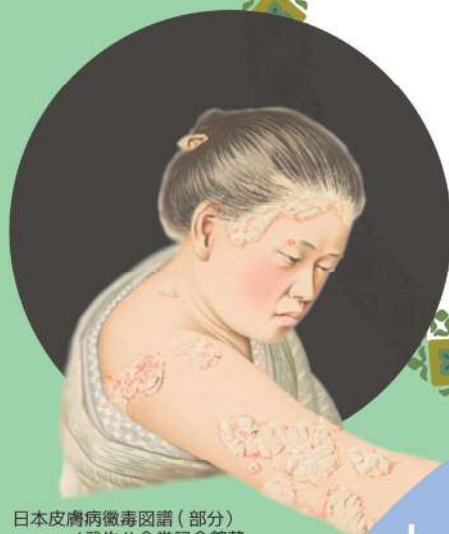
日本皮膚病徴毒図譜(部分)