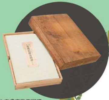
日本皮膚病徴毒図譜 / 武生公会堂記念館蔵