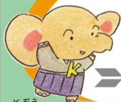
Kぞう (当展覧会オリジナルキャラクター)