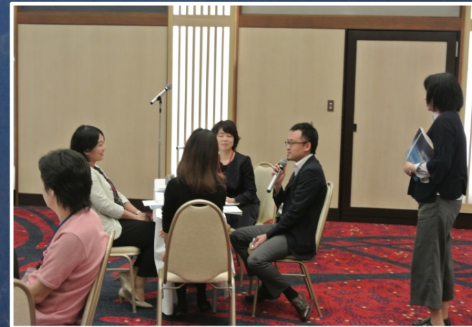
コンフリクトマネジメントのセッションでは、関西からの参加者によるロールプレイングがリアルで実際のコンフリクト場面に遭遇した感じを受けました。