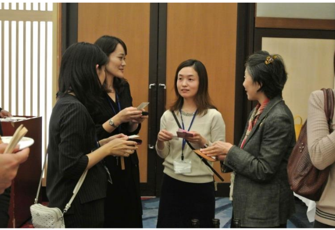
名刺交換セミナー後、実際に参加者と名刺交換をして交流を深めています！