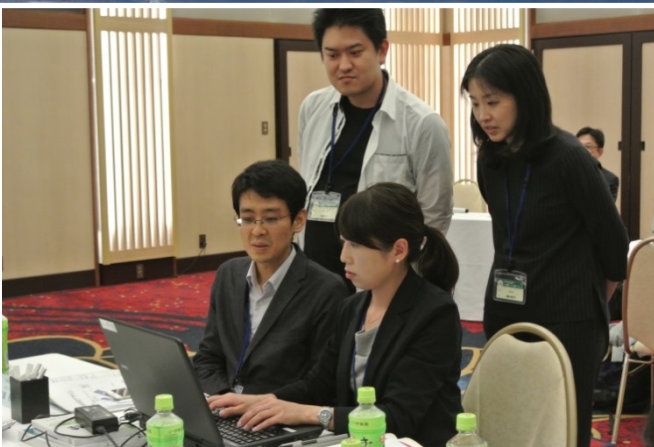
前向き？後向き？介入？？ 各チームで頭をひねりながら臨床研究デザインを検討中…