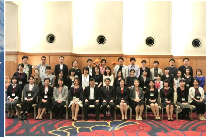
参加者、講師、ファシリテーター全員集合！（^^）